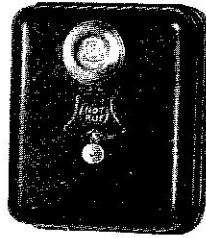
Nr. 352 00

Notruf-Hauptmelder mit plombierbarer Druckknopfauslösung sind in einem graulackierten Metallgehäuse eingebaut und für den Anschluß an ein Polizei-Notrufnetz eingerichtet.