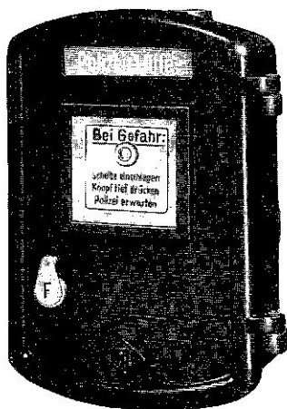
Nr. 352 03