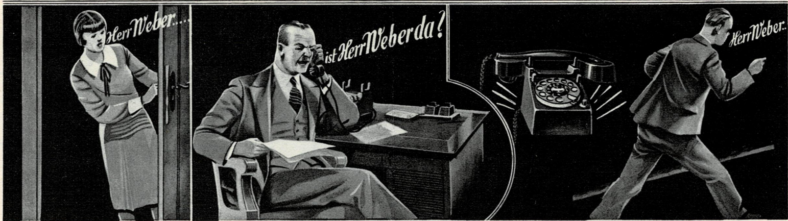
Bild 1: Ohne Suchsignal! Der Gewünschte wird vom Personal gesucht.